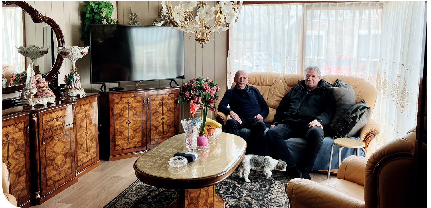
Woonwagengewoners komen van oudsher graag bij elkaar over de vloer.